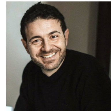
Simone Rea (illustratore)