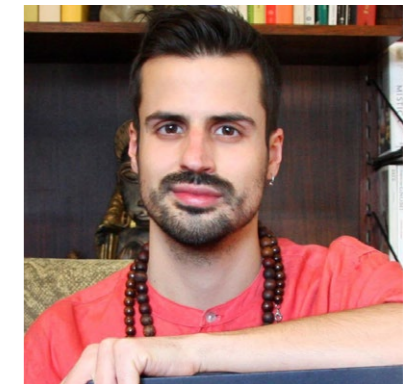
Michelangelo Rossato (illustratore)